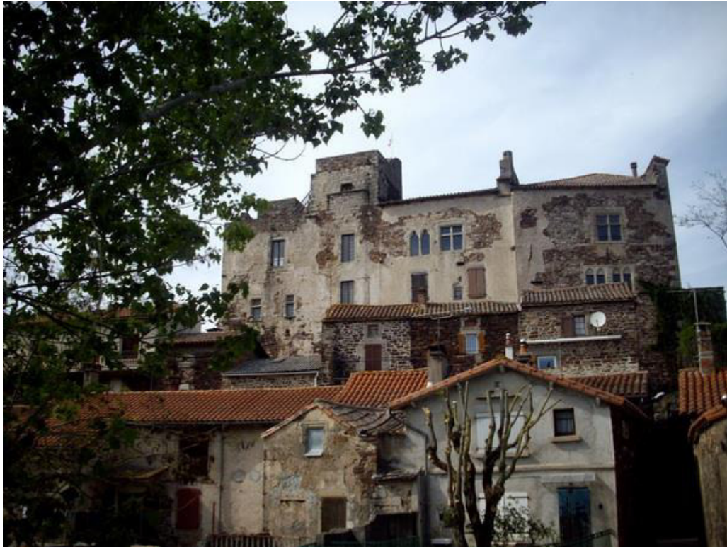
Château de Latour sur Sorgues