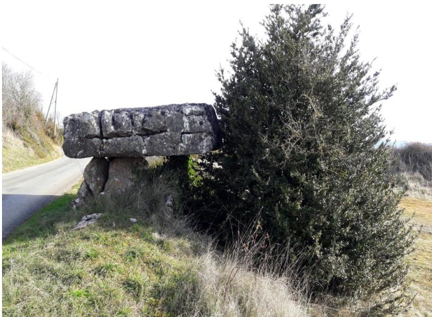
Dolmen de Crassous