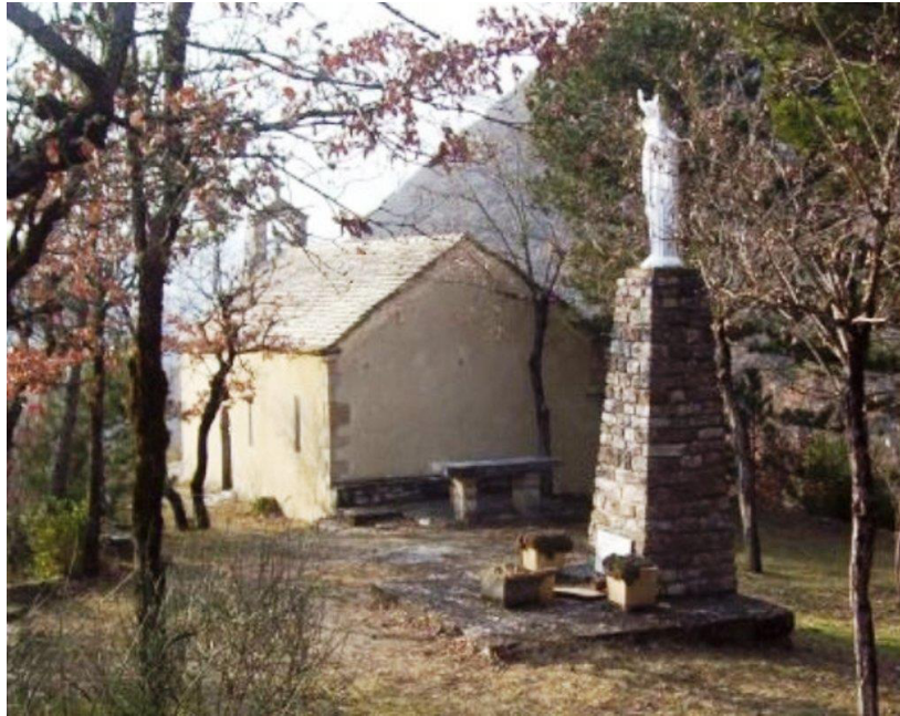
Chapelle Notre Dame du Cayla MC