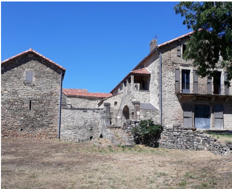
Ferme caussenarde de Soulsou